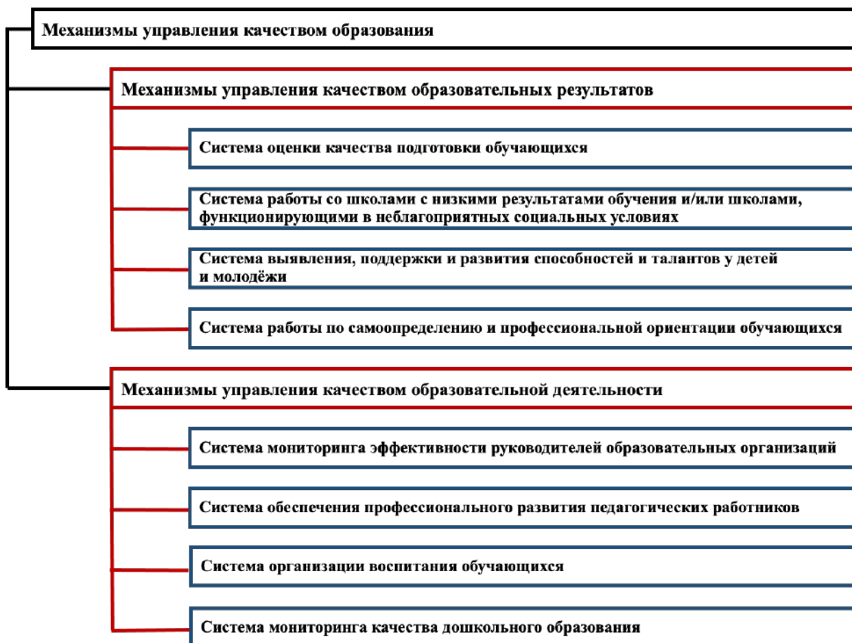
Рисунок 1 – Направления оценки

Направления Оценки представлены на рисунке 1.